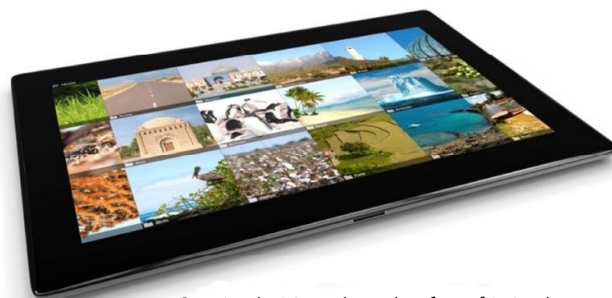
SiteAudit Visualizer läuft auf Windows Tablet-PCs und Windows Arbeitsplätzen